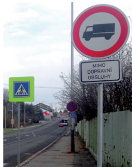
Tabule zakazují vjezd nákladních vozidel na ulici Těšínskou.

Podařilo se nám vyřešit dva zapeklité problémy. Po několika letech se nám podařilo pronajmout hřiště TJ Baník Radvanice. Až do roku 2016 by měli hřiště a zázemí využívat fotbalisté FC Baníku Ostrava. A prospěch z toho budou mít o naši občané. Pronajali jsme také Společenský dům v Bartovicích, kde skončil