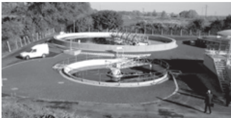
■ Čistírna odpadních vod Kopřivnice

STASPO, spol. s r.o., se od svého vzniku dynamicky rozvíjí, o čemž svědčí řada úspěšně provedených staveb a neustále vzrůstající objem provedených prací. Firma pracuje hlavně v ostravském regionu, odkud pochází také nejvíce zakázek. Společnost STASPO, spol. s r.o., například v poslední době pracovala na