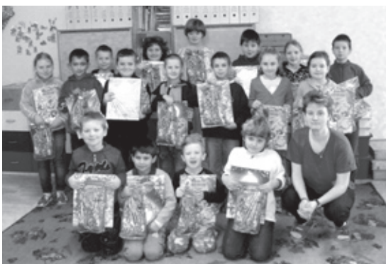
■ Děti s mikulášskou nadílkou.

Měsíc prosinec je ve znamení příchodu zimy, ale také Mikuláše. Těšíme se hlavně na nejkrásnější svátky roku – na Vánoce. Ani u nás ve škole jsme nenechali nic náhodě.