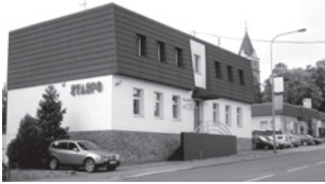
■ Správní budova před a po rekonstrukci