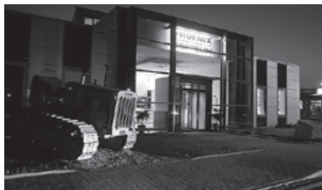
■ CATERPILLAR v noci

STASPO, spol. s r.o., po celou dobu své existence